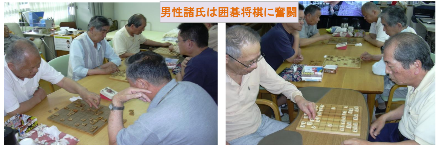
男性諸氏は囲碁将棋に奮闘

室町時代の女官が使っていた言葉の名残りらしいですけどねえ・・・ ちなみに私は「おかゆさん」ではなく、「おかいさん」です(笑)