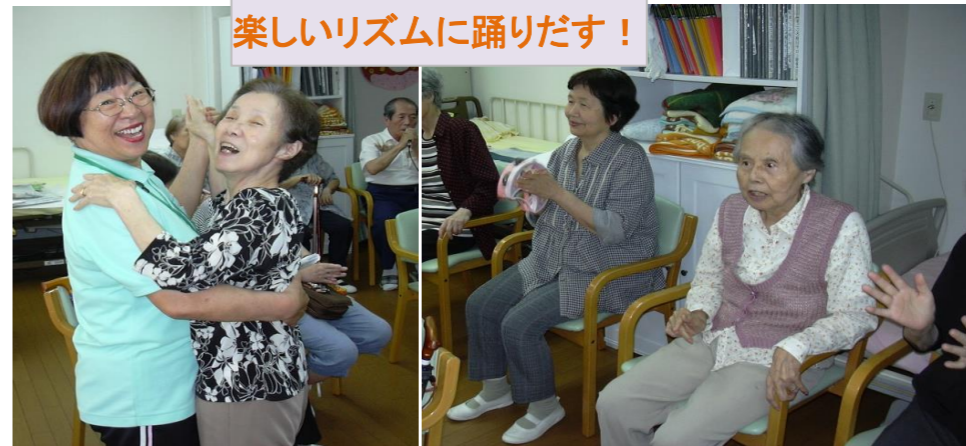
楽しいリズムに踊りだす！