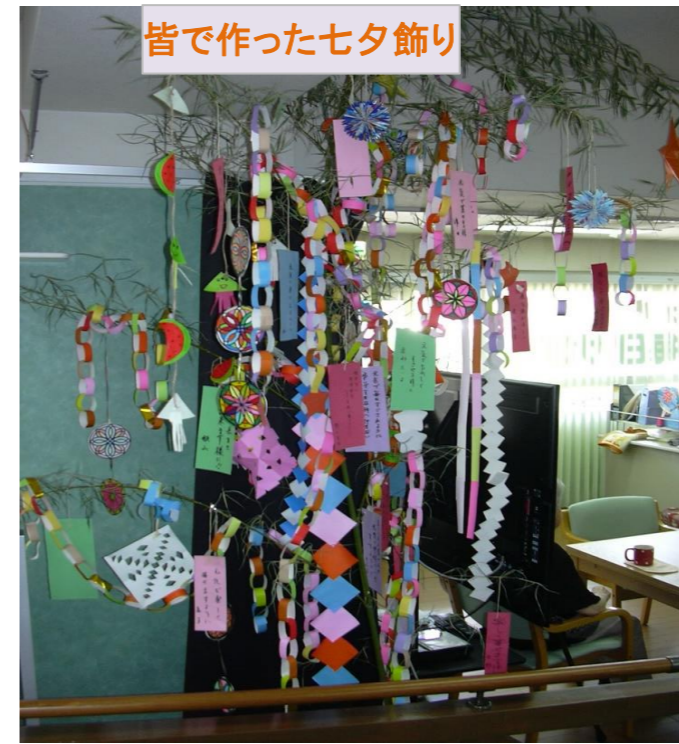
皆で作った七夕飾り